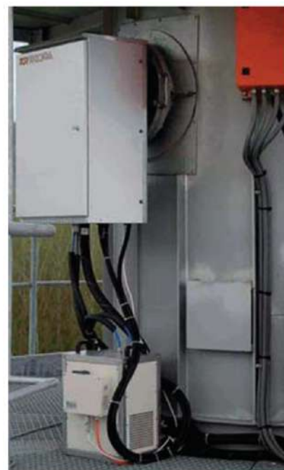
Installazione a camino