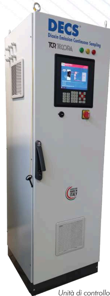
Unità di controllo