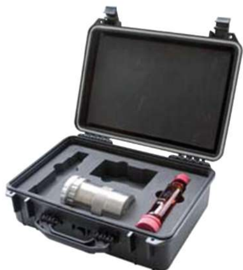
Valigia di trasporto per portafiltri

è fornito con licenza a pagamento e permette di ottenere, oltre alle funzioni sopra descritte, anche la piena operatività a distanza del DECS ® dalla postazione PC dove è installato il software di controllo e supervisione.