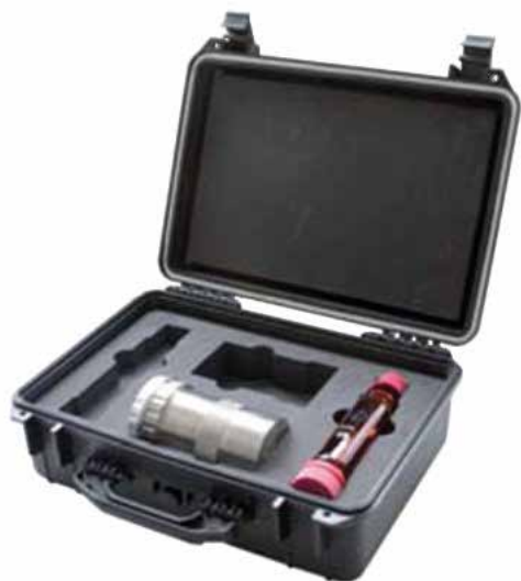
Valigia di trasporto per portafiltri

è fornito con licenza a pagamento e permette di ottenere, oltre alle funzioni sopra descritte, anche la piena operatività a distanza del DECS ® dalla postazione PC dove è installato il software di controllo e supervisione.