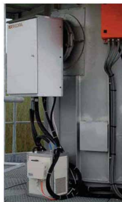
Installazione a camino