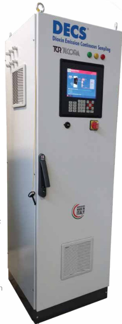
Unità di controllo